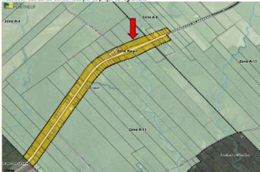
Illustration des zones concernées par ce projet de règlement:

Ainsi, une demande relative à la disposition apparaissant à l'article 5 mentionnant la modification de la grille des spécifications peut provenir des personnes intéressées de la zone Ra/a-1 directement visée par celle-ci. Elle peut aussi provenir d'une zone qui est contiguë à celle-ci, soit des zones A-4, A-6, A-11 et A-12.